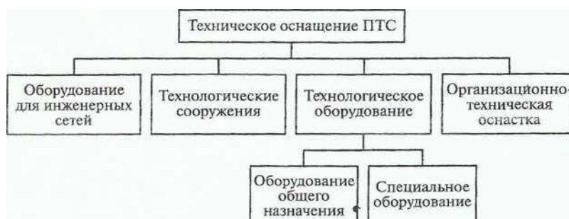
Состав оборудования, используемого на ПТС

Организационная оснастка — это вспомогательное оборудование, обеспечивающее удобство выполнения основных работ (стеллажи,