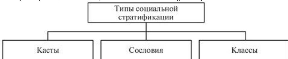
Рис. 2. Основные исторические типы социальной стратификации

Распределение социальных групп и людей по стратам (слоям) позволяет выделить относительно устойчивые элементы структуры общества (рис. 1) с точки зрения доступа к власти (политика), выполняемых профессиональных функций и получаемого дохода (экономика). В истории представлены три основных типа стратификации – касты, сословия и классы (рис. 2).