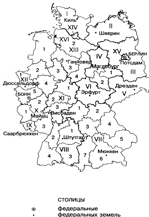
Рис. 1. Административно-территориальное деление ФРГ ( по [ 3 ] ).