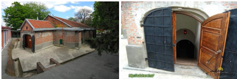
Рис. 15. Пороховой погреб, вход в погреб