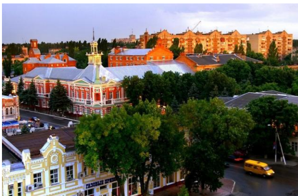
Рис. 3. Вид Азова

Город Азов находится недалеко от Ростова-на-Дону – в 42 километрах, на западе Ростовской области. Город расположен на реках Дон и Азовка. Площадь города составляет 68 квадратных километров. Сейчас в Азове живёт 82 тысячи человек. Это небольшой, но красивый город в Ростовской области.