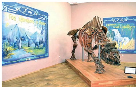
Рис. 10. Скелет кавказского эласмотерия