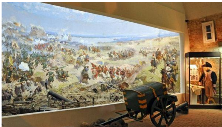
Рис. 18. Общий вид диорамы

Так зрители становятся свидетелями этого великого события.