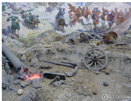
Рис. 17. Диорама «Взятие Азова войсками Петра I в 1696 г.»