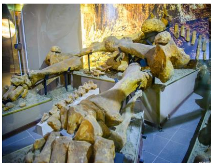
Рис. 11. Скелеты мамонтов

Самым популярным экспонатом музея является единственный в России скелет слона-трогонтерия (высота животного – 4,5 метра), его возраст – 600 тысяч лет. В мире известно несколько скелетов трогонтериевого слона. Азовский экземпляр – один из самых больших скелетов слона в мире и единственный скелет с сохранившимся черепом слона данного вида.