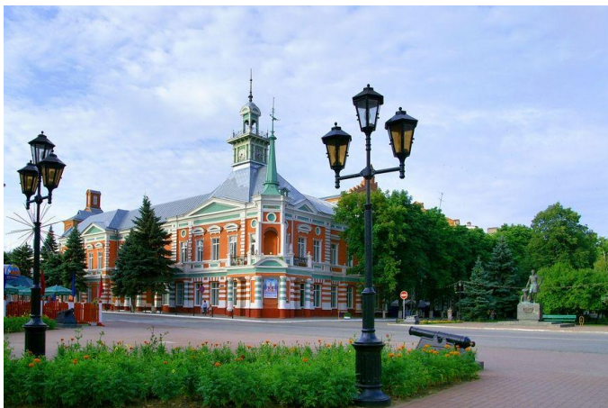
Рис. 8. Азовский музей

В старинном здании (построено в 1892 году) располагается известный Азовский историко-археологический и палеонтологический музей (Рис.8).