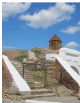
Рис. 6. Алексеевские ворота (вход и выход)

В XVIII веке крепость достроили, сделали выше. Вход в крепость был через Алексеевские ворота. В начале своей истории ворота были деревянными (1770 г.), потом были перестроены в каменные.