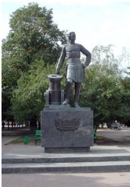
Рис. 7. Памятник Петру I.