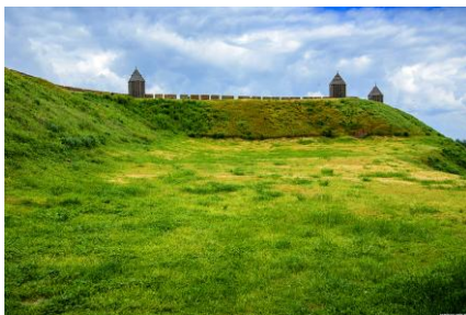
Рис 2. Часть крепостного вала

Город Азов находится недалеко от Ростова-на-Дону – в 42 километрах, на западе Ростовской области. Город расположен на реках Дон и Азовка. Площадь города составляет 68 квадратных километров. Сейчас в Азове живёт 82 тысячи человек. Это небольшой, но красивый город в Ростовской области.