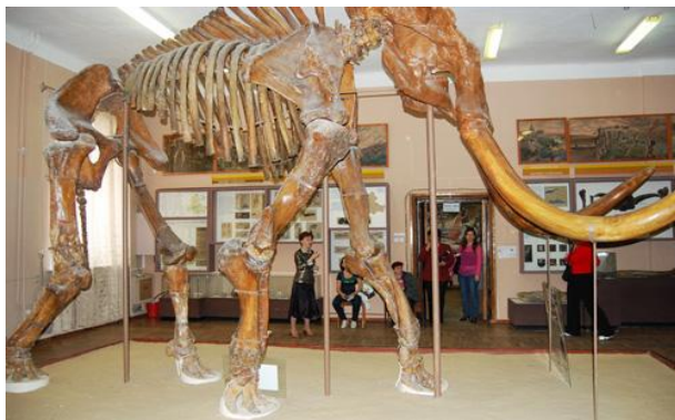
Рис. 12. Трогогтериевый мамонт (слон)

Также в экспозиции представлены интересные находки: трогогтериевый бобр, винторогая антилопа, ливенцовская лошадь, азовский жираф. Науке они стали известны благодаря тому, что впервые их кости были найдены в донской земле.