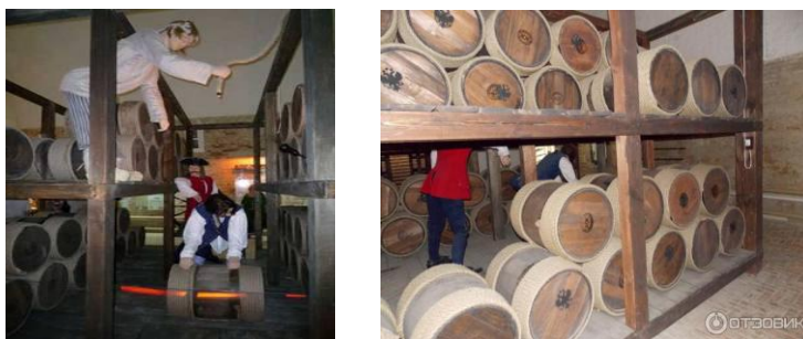
Рис. 16. Экспозиция порохового погреба

Задание 2.6. Употребите в нужной форме слова, которые даны в скобках (измените последовательность слов там, где это необходимо).