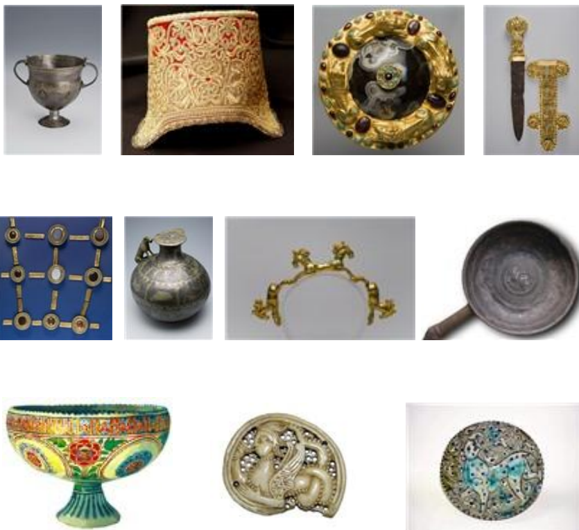
Рис. 14. Предметы сарматского клада

Гордость музейного собрания – экспозиция «Сокровища кочевников Евразии». Здесь более 20 000 редких экспонатов с III тысячелетия до нашей эры по XIV век нашей эры. Огромный интерес представляют находки из сарматского клада (I век нашей эры). Это золотые и серебряные изделия работы греческих и восточных мастеров.