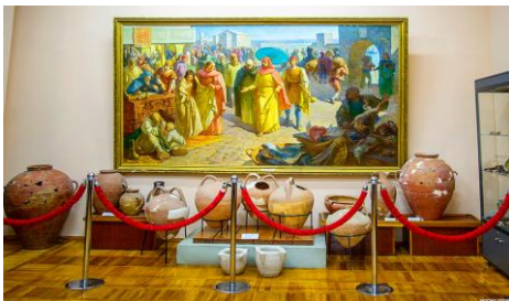
Рис. 4. Макет крепости «Азак» Рис. 5. «Азак» – крупный торговый город

В 1637 году донские казаки первый раз взяли крепость, освободили от турок и удерживали её до лета 1642 года. Город несколько раз переходил от русских к туркам и обратно.