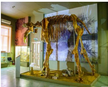
Рис. 9. Скелет динотерия

В музее собрана богатая палеонтологическая коллекция: скелет динотерия (это животное обитало на территории Приазовья восемь миллионов лет назад), скелет кавказского эласмотерия, скелеты двух мамонтов (их геологический возраст 700-800 тысяч лет).