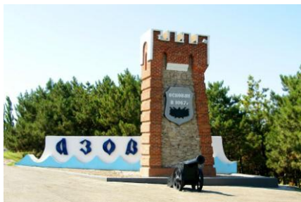
Рис. 1. Въезд в город Азов