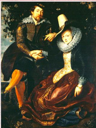
Автопортрет с женой Изабеллой Брандт. 1609 г.