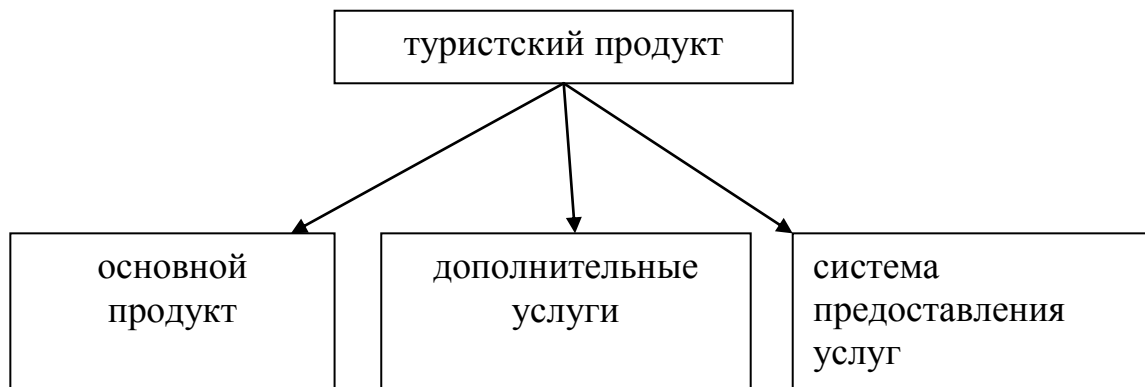
Рисунок 1 - Структура туристского продукта

Главным среди составляющих туристского продукта является основной продукт, который указывает на то, что в конечном счете приобретает турист. Иными словами, за что турист платит деньги и чем занимается туристическая организация.