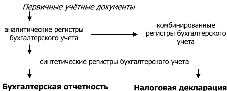
Рис. 2. Формирование показателей налоговой декларации

В основу этой модели положены данные, формируемые в системе бухгалтерского учёта.