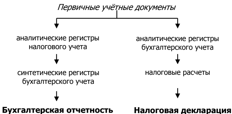
Рис. 1. Формирование показателей налоговой декларации

Данная модель предусматривает использование самостоятельных аналитических регистров налогового учёта, при этом налоговый учёт ведётся параллельно с бухгалтерским учётом. Преимуществом данной модели является то, что она даёт реальную возможность получать данные для формирования