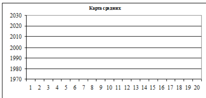
Рисунок 1 – Карта средних значений