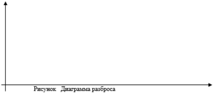
Рисунок Диаграмма разброса