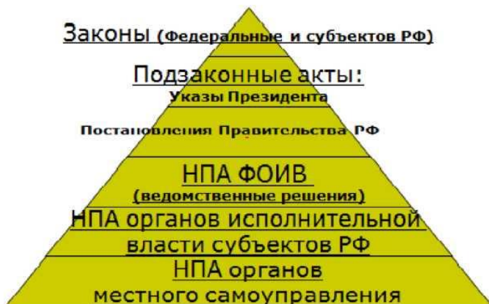
Рисунок 2.1. Нормативно-правовые акты по ОТ

В нашей стране сложилась достаточно определенная система нормативно правовых актов (НПА) регламентирующих вопросы ОТ. В настоящее время НПА можно представить в виде «пирамиды» из пяти уровней (рис.2.1). Эта «пирамида» кроме номенклатуры НПА также символизирует верховенство (приоритет) высших уровней НПА над низшими уровнями. Это означает, что требование, регламентированное, например, в законе, не может быть ослаблено в документах другого уровня.