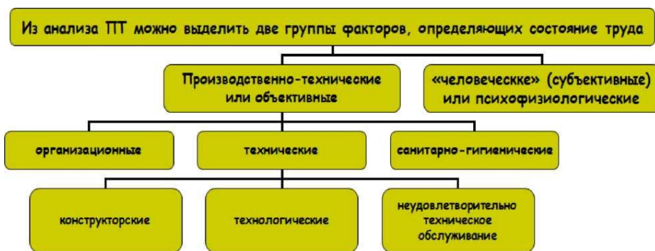
Рис.7.2. Причины несчастных случаев

При всем возможном многообразии причин НС их можно условно разделить на группы, приведенные на рисунке 7.2.