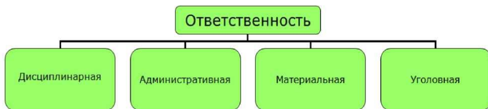
Рис. 9.1 Виды ответственности за нарушение охраны труда

Законодательством РФ предусмотрена ответственность для руководителей и иных должностных лиц, а также работодателей – физических лиц, виновных в нарушении трудового законодательства и иных НПА, содержащих нормы трудового права, в том числе для лиц, препятствующих осуществлению государственного надзора и контроля, и не исполняющих предъявленные им предписания. Возможные виды ответственности приведены на рис.9.1.