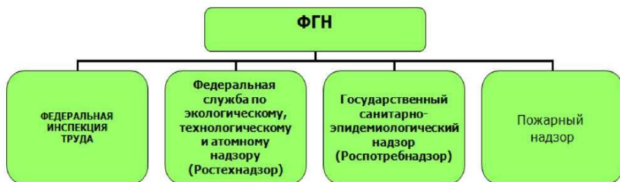
Рис.8.1. Структура федерального государственного надзора в РФ

Структура ФГН в РФ приведена на рисунке 8.1.