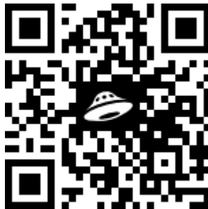
Рисунок 1 – Qr-code ссылка на нормативные документы по оформлению отчёта по преддипломной практике

Отчёт должен быть оформлен в соответствии с общими требованиями, предъявляемыми к отчётным материалам (курсовым работам и т.п.). Все необходимые нормативные документы по оформлению отчёта по практике, а также образец заполненного отчёта и титульные листы представлены по ссылке на рисунке 1.