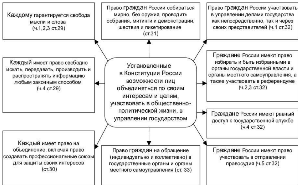
Рис 1. Политические права и свободы