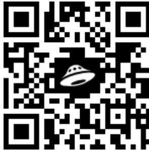
Рисунок 1 – Qr-code ссылка на нормативные документы

Материалы магистерской диссертации должны состоять из структурных элементов, расположенных в следующем порядке: